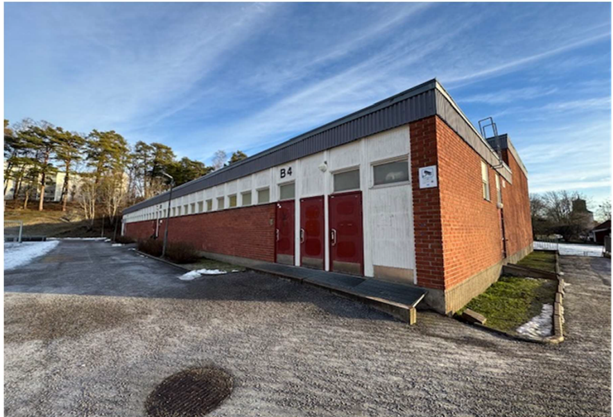
Fotot visar Kämpingeskolans skolgymnastikbyggnad.